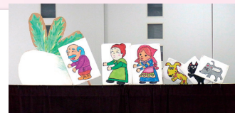
ペープサートとは？ペープサートは、物語の登場人物が描かれた紙に棒を付けたものを人が動かすことによって演じる紙人形劇です。

キャッシュカードの一日の引き出し限度額は50万円です。被害に遭うと、毎日現金を引き出されます。引出し限度額は、ほとんどの金融機関のATMで変更できます。1回の引出し限度額を50万円から5万円に減らすだけでも、被害金額を減らすことができます。