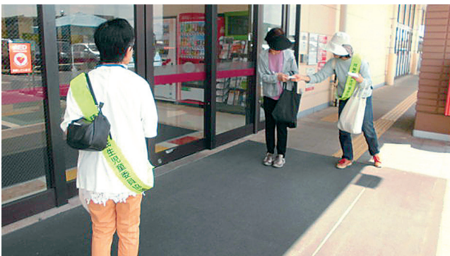
アピタ精華台店にて啓発活動