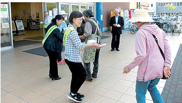
せいかガーデンシティにて啓発活動