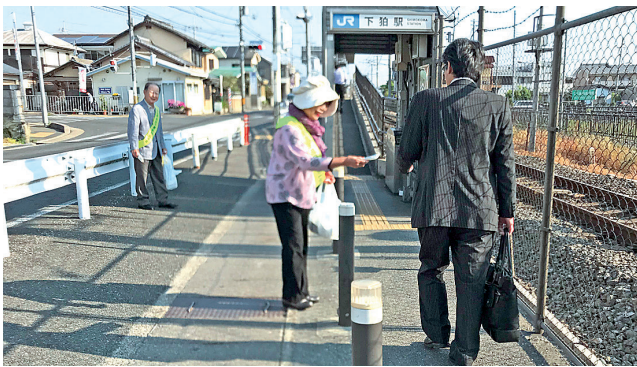
JR下狛駅にて啓発活動