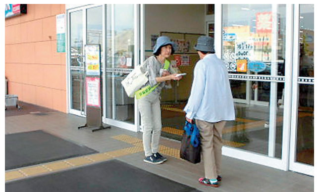
アル・プラザ木津にて啓発活動

民生委員は、社会奉仕の精神をもって、常に住民の立場に立って相談に応じ、及び必要な援助を行い、もって社会福祉の増進に努めるものとする。（民生委員法 第一条より）