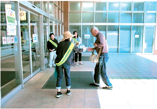
せいかガーデンシティ入口付近での啓発活動

毎年5月12日は「民生委員・児童委員の日」です。これは、大正6（1917）年5月12日に民生委員制度の源である濟世顧問制度を定めた岡山県濟世顧問制度規程が公布されたことに由来するものです。 この日から1週間（5月12日から18日）を「活動強化週間」と定めています。