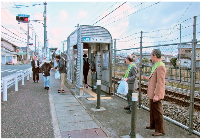
JR下狛駅前での啓発活動

事務局：〒619-0243 京都府相楽郡精華町大字南稲八妻小字砂留22番地1（精華町地域福祉センターかしのき苑内） TEL.0774-94-5200 FAX.0774-93-2278 URL http://www.minsei-seika-kyoto.jp/ E-mail minkyos@town.seika.lg.jp