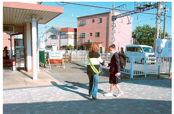
近鉄山田川駅前での啓発活動

民生委員は、社会奉仕の精神をもって、常に住民の立場に立って相談に応じ、及び必要な援助を行い、もって社会福祉の増進に努めるものとする。（民生委員法 第一条より）