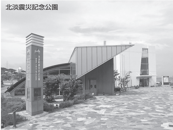
北淡震災記念公園

野島断層といわれる、阪神・淡路大震災の際に出現した断層や、実際、被災された方のお話など大変貴重な、そして考えさせられる研修と