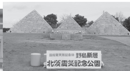
野島断層 (北淡震災記念公園)