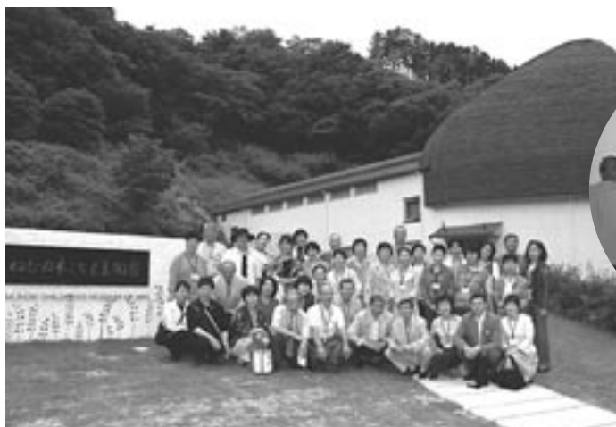
全員管外研修「ねむの木学園」平成19年6月25日