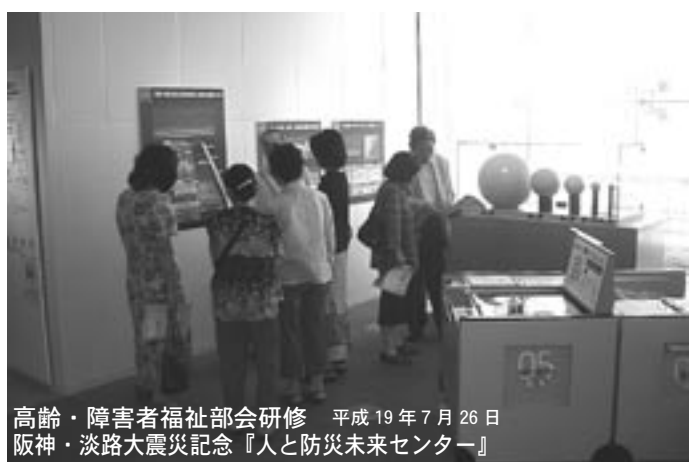
高齢・障害者福祉部会研修 平成19年7月26日 阪神・淡路大震災記念『人と防災未来センター』