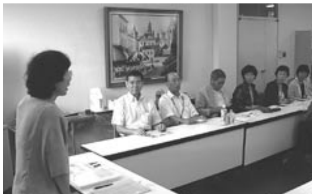
児童福祉部会研修「交野女子学院」平成19年8月24日

毎年、精華町民生児童委員協議会では、全員参加による研修や各部会ごとによる研修を、それぞれ実施しています。ここでは、各研修ごとに委員の方々から寄せていただいた感想を紹介します。